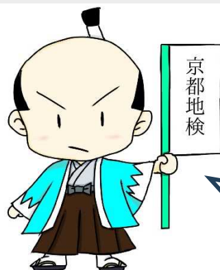
まこと君！令和ver. ( 広報キャラクター )